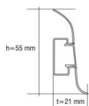
ROZMĚR 55x21 mm